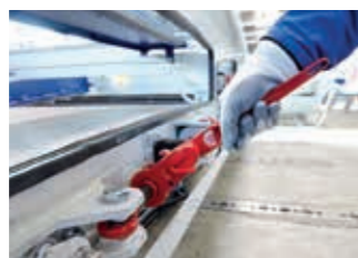
00:40 min Über einen Schnellspannverschluss wird das Gewebe entspannt.