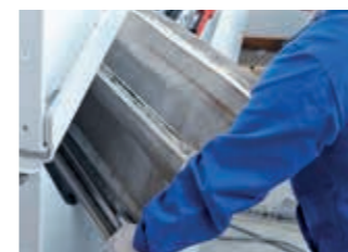
02:30 min Das neue Gewebe wird eingelegt.