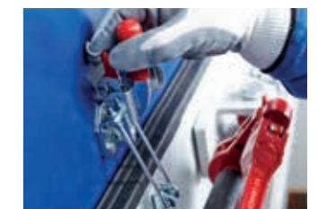
05:00 min Die Wartungstüren werden wieder geschlossen und dichten das Gewebe seitlich zum Siebkasten ab.