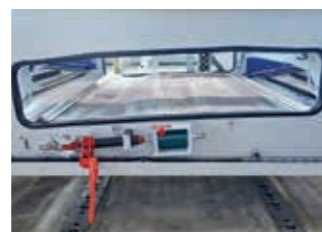
02:10 min Das Gewebe ist entspannt.