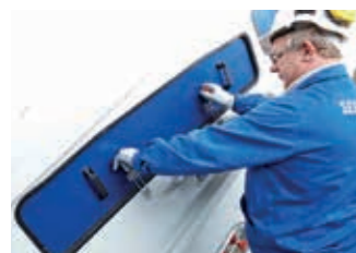
00:00 min Die Wartungstüren am defekten Gewebe werden beidseitig geöffnet.