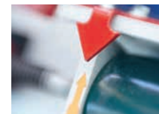
04:20 min Die optimale Gewebespannung wird über eine Markierung angezeigt.