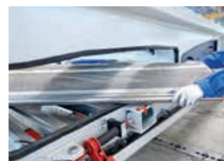
02:15 min Das Gewebe kann platzsparend zusammengelegt und entnommen werden.