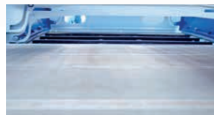
Optimal gespanntes Sandwichgewebe.