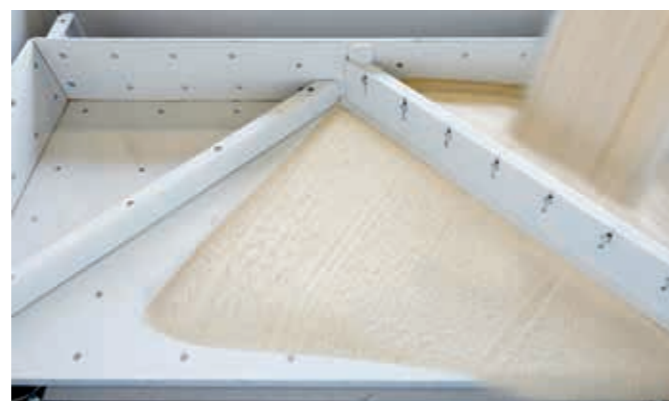
Materialverteilung in der integrierten Aufgaberinne.