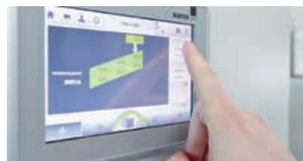
Einfache Bedienung mit Hilfe des TouchPanels.