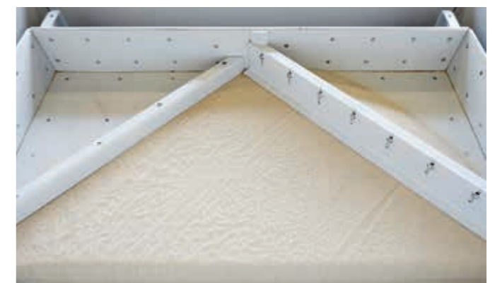
Das Aufgabematerial wird auf der vollen Breite des Siebbodens aufgegeben.