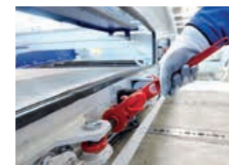
02:45 min Das Gewebe wird wieder mit dem Schnellspannverschluss gespannt.