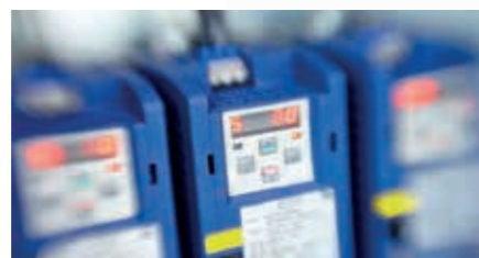
Individuell anpassbare Beschleunigung der Siebgewebe.