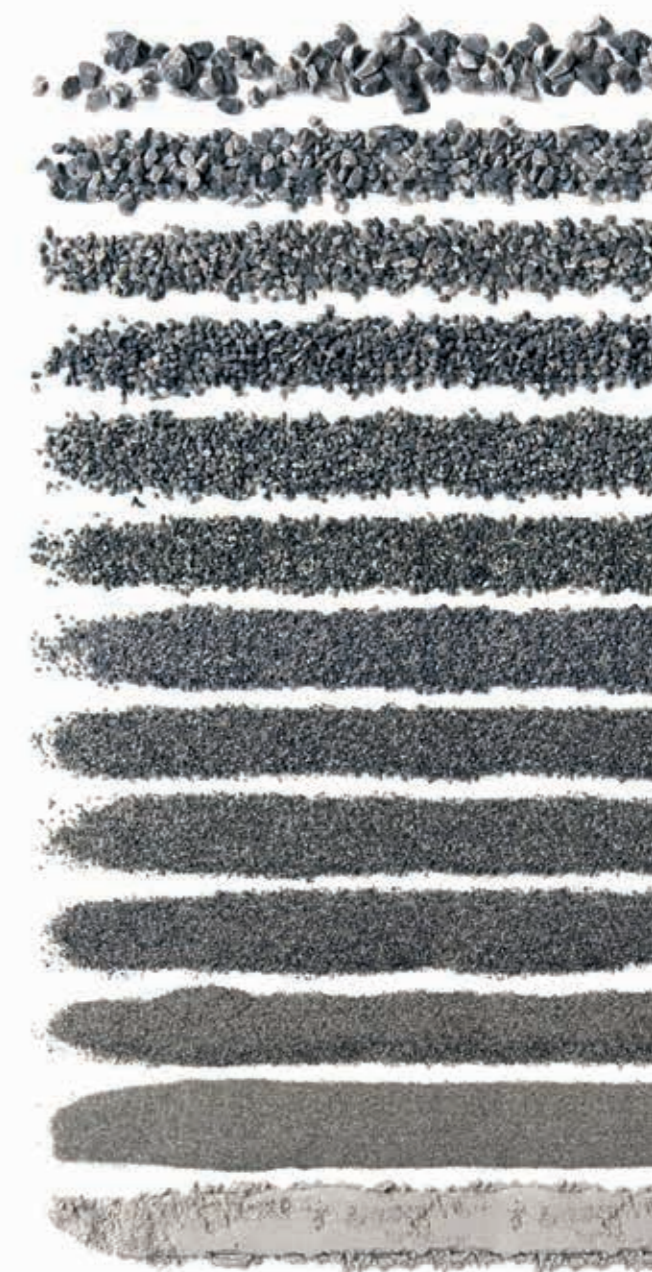
Auf der rechten Abbildung sehen Sie als Beispiel die Korngrößenverteilung von einem typischen FINE-LINE Produkt.